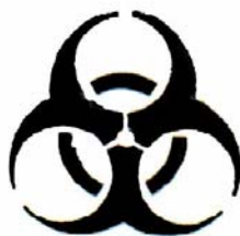
شکل ۱- علامت خطر زیستی

۲-۱۰ اطلاعاتی شامل هرگونه محدودیت در استفاده و هشدار برای استفاده کننده ظرف